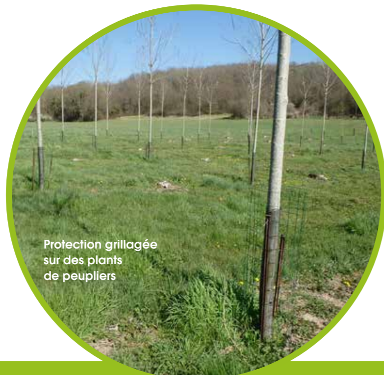
Protection grillagée sur des plants de peupliers