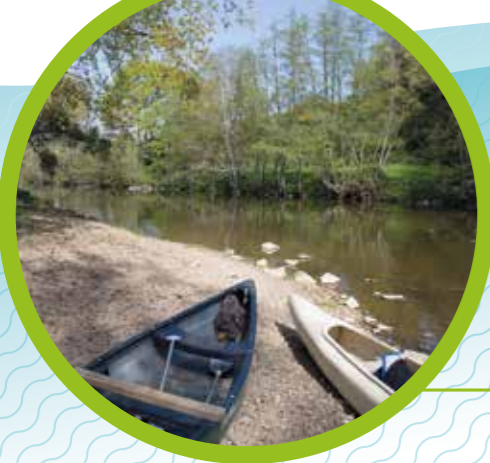
Prospections sur le Thouet à Gourgé