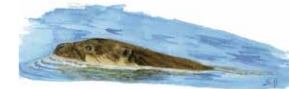
Loutre : nage rapide, souple, silhouette longiligne, pas de dos bombé