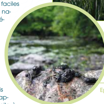
Epreinte de loutre