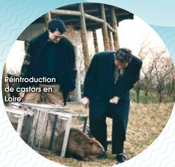
Réintroduction de castors en Loire

La toilette réciproque des castors a une fonction sociale essentielle pour la santé de l'animal.