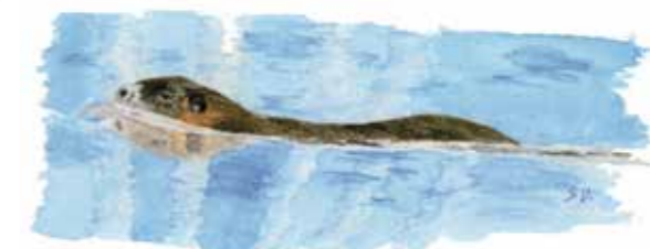
Ragondin : la tête et le dos sont hors de l'eau