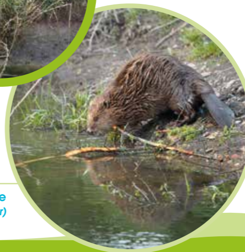
Castor d'Europe ( Castor fiber )