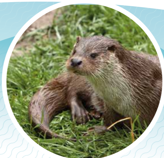
La Loutre d'Europe

La loutre d'Europe ( Lutra lutra ) d'une taille moyenne de 120 cm dont 30 cm pour la queue et d'un poids de 5 à 11 kg, est parfaitement adaptée à la vie aquatique. Son corps long et fuselé, ses pattes palmées et sa puissante queue en font une excellente nageuse.