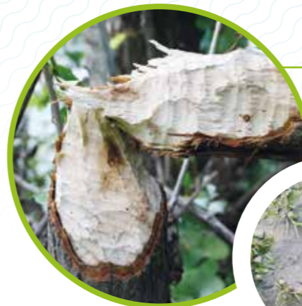
Coupe de castor

Pour ne pas les confondre si vous observez une espèce dans la nature, voici un croquis de leur profil en attitude de nage.