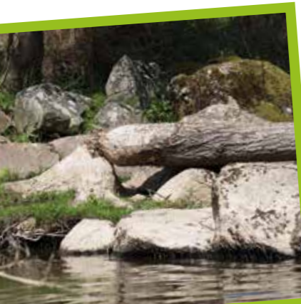
Peuplier coupé par un castor sur le Thouet