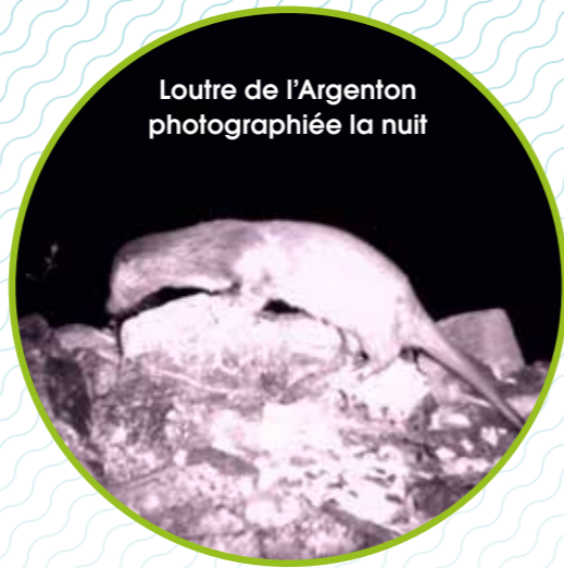
Loutre de l'Argenton photographiée la nuit

Le suivi de la loutre et du castor est mené dans le cadre du « réseau mammifères du bassin de la Loire », organisé par l'ONCFS depuis 2007. Ce réseau regroupe entre autres les syndicats de rivière, les fédérations de pêche et de chasse et les associations naturalistes. Il permet le recensement des espèces et la cartographie de leur répartition.