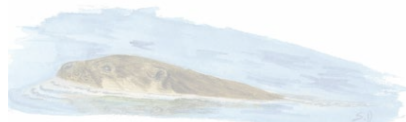
Une loutre en plein repas