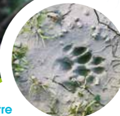
Empreinte de loutre