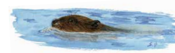
Castor : seule la tête massive dépasse de l'eau

Conception graphique et impression : Imprimerie Thomassin - 79100 - Tél. 05 49 66 00 19