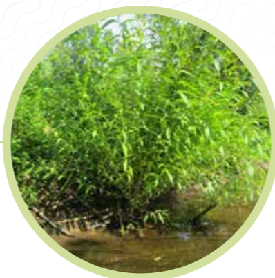
Rejet de saules après la coupe du tronc

Autrefois naturellement présent dans nos cours d'eau et longtemps chassé pour sa fourrure, notamment au Moyen-âge, le castor avait disparu du bassin du Thouet, jusqu'à l'observation en 1998 d'indices de sa présence sur la commune du Courday-Macouard. Les castors s'installant aujourd'hui sont issus d'individus réintroduits sur la Loire de 1974 à 1976.